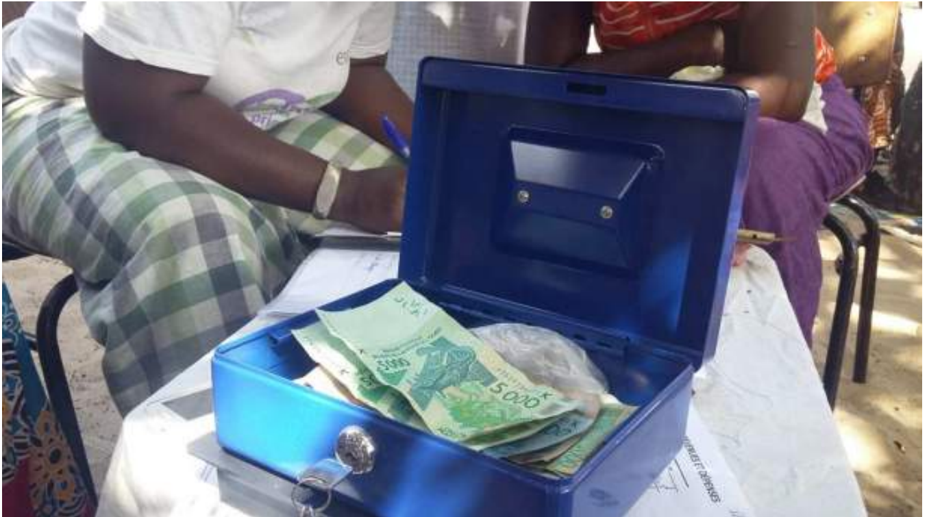
Comunidades Autofinanciadas (CAF) de las islas de la Baja Casamance